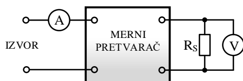
Sl. 1. Blok šema etaloniranja mernog pretvarača naizmenične struje na ulazu, u jednosmernu struju na izlazu

U slučaju etaloniranja mernih pretvarača struje, šema povezivanja je kao na sledećoj slici: