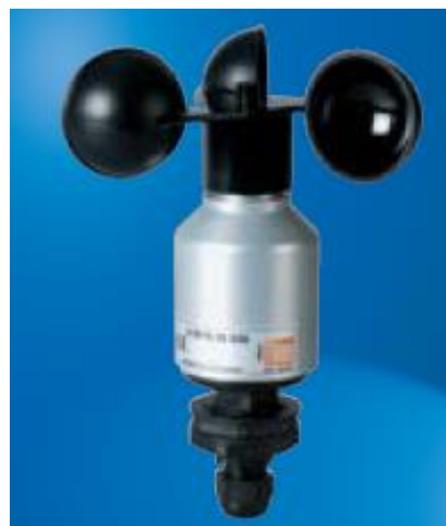
Sl. 2. Anemometar sa šoljicama Thies 4.3519.00. [9]

Mehanički anemometar je proizvod kompanije Thies, model 4.3519.00. sa 3 lopaticice [1], i služi za merenje