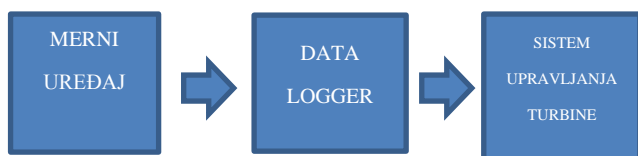
Sl. 1. Blok dijagram mernog sistema vetroturbine

U današnje vreme, potreba za merenjem brzine vetra je prisutna u mnogim sferama privrede. Prvenstveno za potrebe meteorologije, u cilju praćenja vremenskih prilika i ocene zagađenosti vazduha, zatim za sisteme reagovanja u vanrednim situacijama, avionski saobraćaj kao i energetiku. U vetroenergetici, podaci o izmerenoj vrednosti brzine vetra koriste se za planiranje budućih projekata vetroparkova ali i za upravljanje radom postojećih vetroturbina.