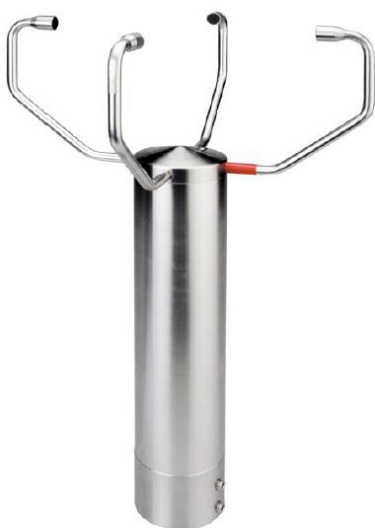
Sl. 3. Ultrasonični anemometar Thies 2D [2]

Ultrasonični anemometar je proizvela, takođe, kompanije Thies, model 2D 4.382x. sa dva para, naspramnih ultrazvučnih pretvarača, na rastojanju od 200 mm [2]. Izlazni signal može biti digitalni i/ili analogni. Anemometar pouzdano radi pri temperaturama od -50°C do +70°C. Merni opseg brzine vetra je 0,01 – 75 m/s (prag detekcije je 0,01 m/s). Što se tiče tačnosti merenja brzine vetra, za brzine do 5 m/s, tačnost je +/- 0,1 m/s, dok za brzine vetra preko 5 m/s, tačnost je +/- 2 % od merene vrednosti [3]. Zbog svoje konstrukcije (otporni materijali, nema pokretnih delova) redovna kalibracija usled starenja nije potrebna.