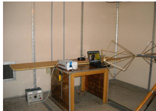
Sl. 1. Ispitivanje nivoa električnog polja EM smetnji.

Ispitivanje je izvršeno u opsegu od 30 MHz do 300 MHz, sa odgovarajućom prijemnom antenom (bikonusna antena), koja je postavljena na rastojanje 1 m od IT uređaja, na visini 1,2 m od poda Faradejevog kaveza. IT uređaj je postavljen na sto, visine 80 cm, i priključen AC/DC adapterom, preko ekvivalentne mreže i razdvojnog transformatora, na mrežu za napajanje. Pri tome, drveni sto je bio dimenzija: dužina 1 m, širina 1 m i visina 0,8 m, na kome se nalazi referentna provodna ploča (od bakra), dužine 2,6 m i širine 1 m (površina ploče 2,6 m 2 ), pri čemu je ploča savijena pod pravim uglovima na dva mesta (Sl. 1).