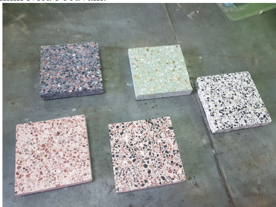
Slika 2: Ispitivani uzorci keramičkih materijala za oblaganje

Ispitivani materijal predstavljaju keramičke ploče za oblaganje, starosti preko 20 godina, izrađene sa različitim pigmentima (slika 2). Pomenute ploče nisu izlagane eksploatacionim uslovima. Pre ispitivanja je svaki od uzoraka pregledan u cilju utvrđivanja vizuelnih tragova destrukcije ili drugih nedostataka. Konstatovano je da su uzorci kompaktni, pravilnih ivica i očuvani.